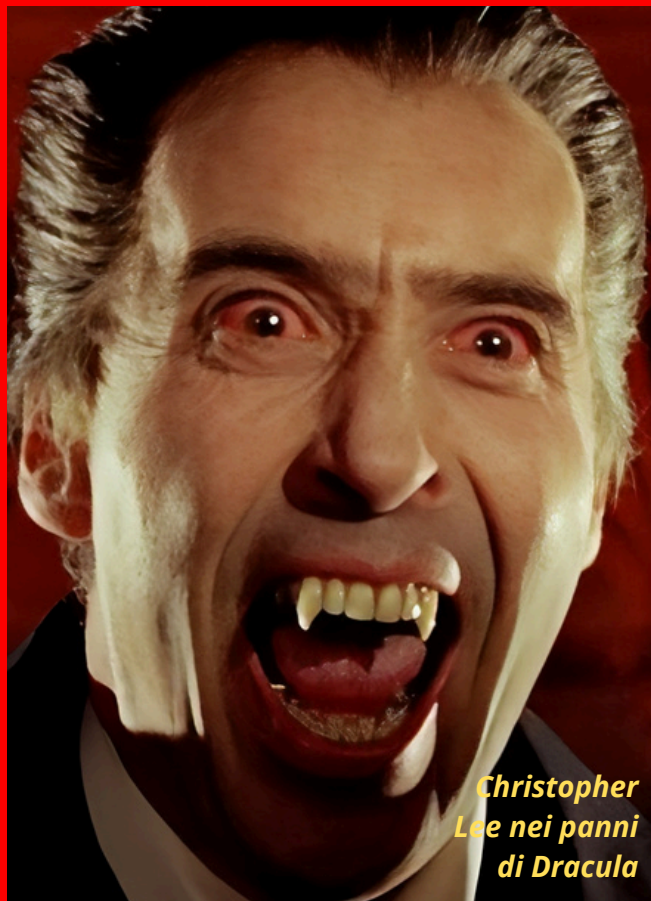
Christopher Lee nei panni di Dracula

Sir Christopher Lee è l'iconico volto del Conte Dracula nella celebre saga della Hammer Film Productions. Ha interpretato il celebre vampiro in 8 opere ufficiali tra il 1958 e il 1973, affiancato spesso dallo storico antagonista Peter Cushing (nei panni di Van Helsing )