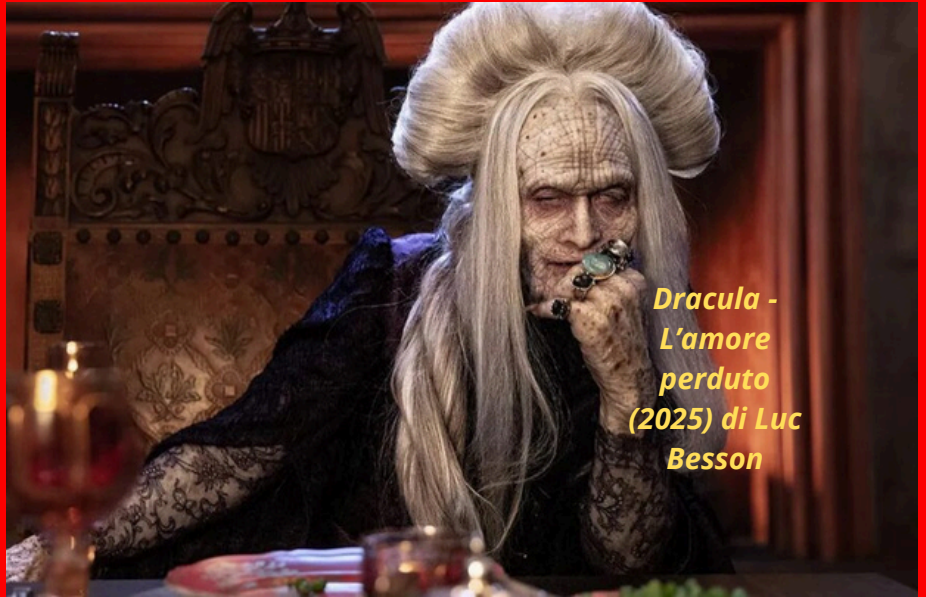
Dracula - L'amore perduto (2025) di Luc Besson