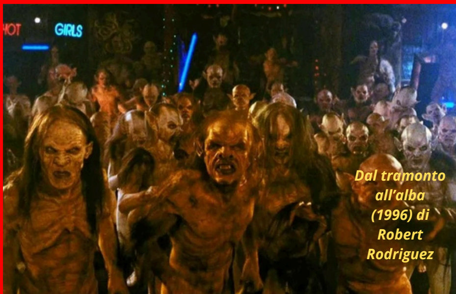
Dal tramonto all'alba (1996) di Robert Rodriguez