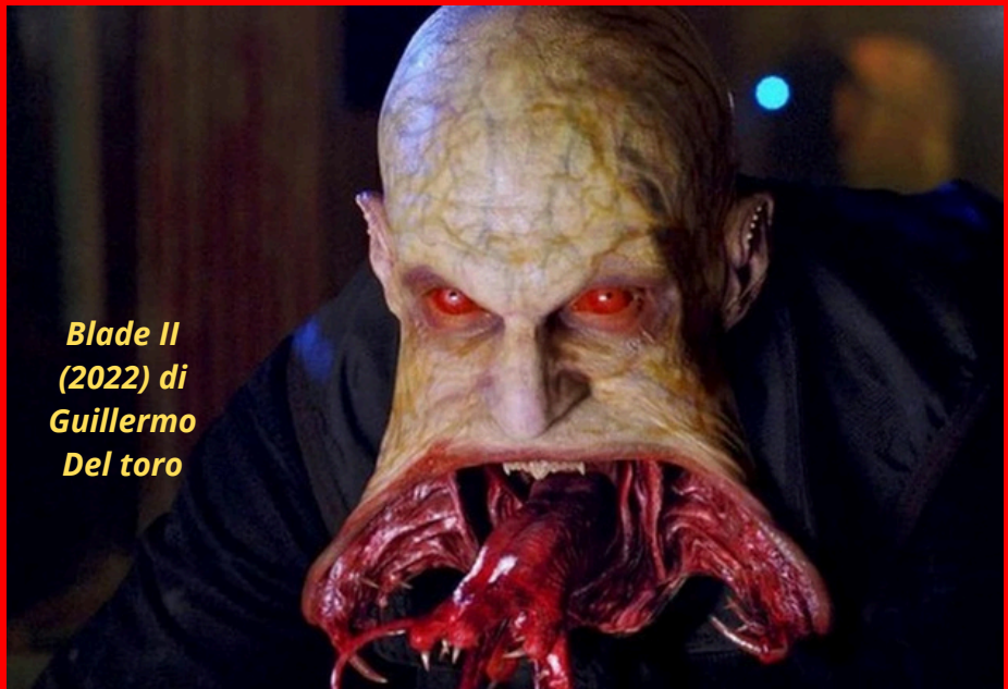
Blade II (2002) di Guillermo Del Toro