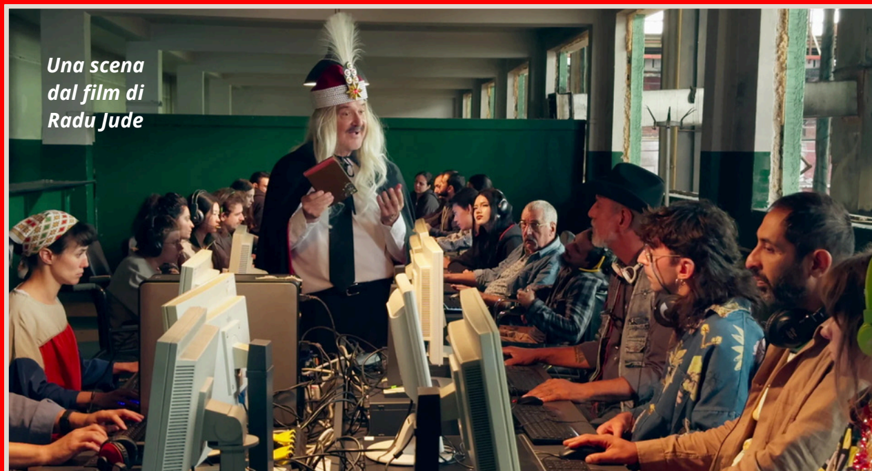
Una scena dal film di Radu Jude