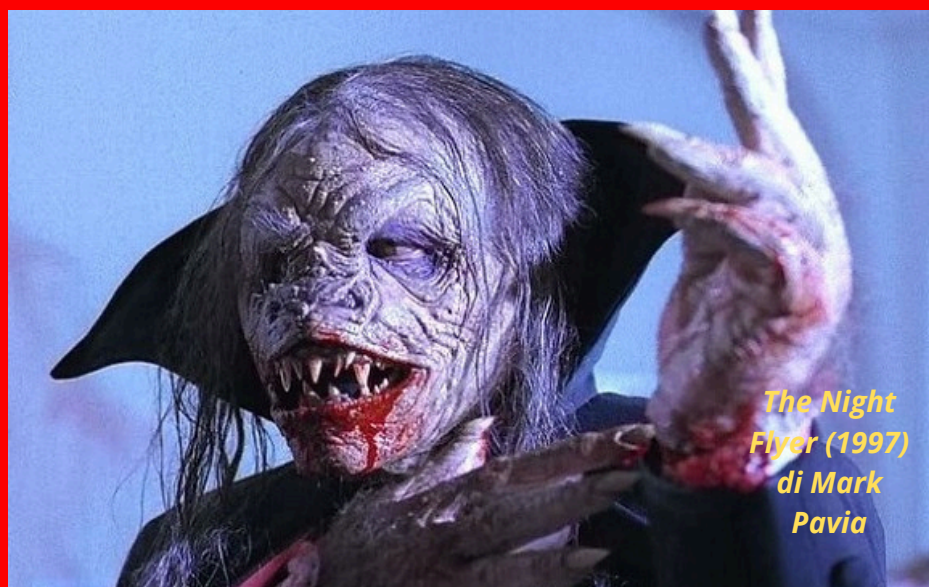
The Night Flyer (1997) di Mark Pavia