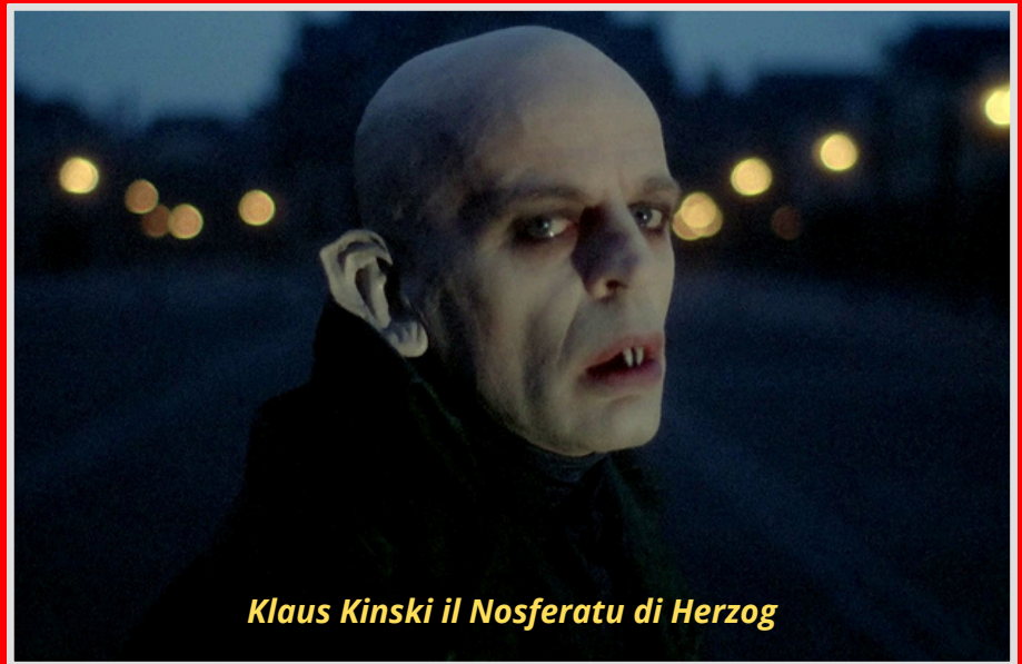
Klaus Kinski il Nosferatu di Herzog

giustamente alla storia come le più belle prove d'autore sul Vampiro par excellence. Naturalmente con le differenze dovute non solo agli stili così diversi tra i due cineasti ma anche ai modi differenti d'intendere il cinema nei confini produttivi e culturali dei loro Paesi. Fatto sta che il Nosferatu herzogiano fa sponda sull'espressionismo rimbalzato a sua volta dalla letteratura gotica ottocentesca, aprendo poi la strada alla solitudine di un protagonista Ostaggio del Tempo e condannato per sempre al non-amore. Il Dracula coppoliano, non ostante il suo titolo, è quasi del tutto infedele al proprio referente letterario e l'archivista giovine che viaggia in Transilvania richiesto dal Conte Dracula promuove un racconto architettato per sbalordire in cifra meta-cinematografica. Dunque, a modo loro, due eroi: entrambi decadenti, diversamente romantici e visionari, ciascuno appartenente alla propria epoca, dunque all'Ottocento di Herzog e al Novecento di Coppola.