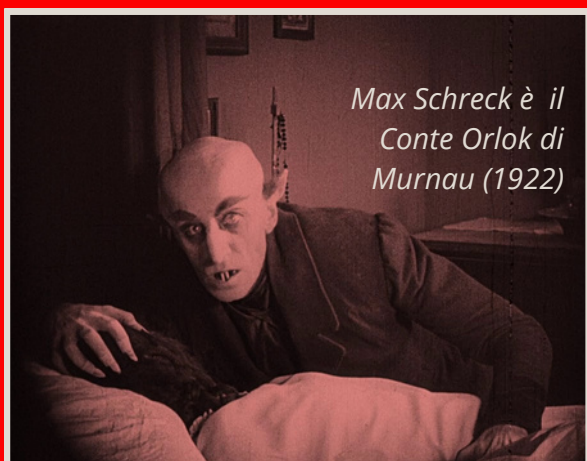
Max Schreck è il Conte Orlok di Murnau (1922)

pagina per credere... Poi naturalmente ci occuperemo dei canini insanguinati, perché la pagina che segue è dedicata a un attore di culto come Christopher Lee, quasi un Dracula par excellence tra le innumerevoli versioni per il cinema del goticissimo romanzo di Bram Stoker (1897) ispirato alla figura Vlad III, principe di Valacchia. Poi ci sarebbero le differenze, mica da poco, tra Nosferatu e Dracula , per non parlare di vampiri cosiddetti "semplici", proprio come soldati di truppa (ma