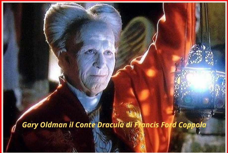
Gary Oldman il Conte Dracula di Francis Ford Coppola