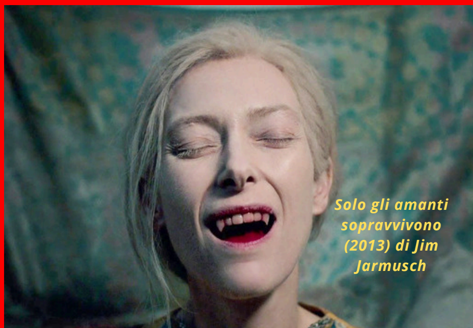
Solo gli amanti sopravvivono (2013) di Jim Jarmusch